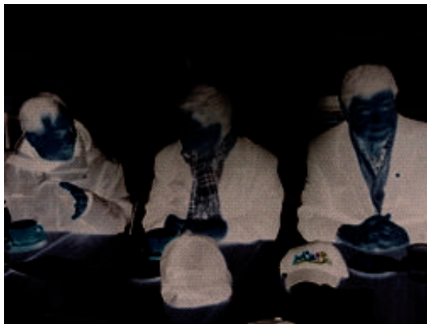
連江縣長劉增應(左)教育部長吳思華(中)立委陳雪生(右)討論馬祖教育問題

教育部長吳思華完成兩天關懷連江縣偏鄉學校的行程，期間馬不停蹄地走訪四所中小學，了解學校辦學情況和亟待解決的問題；部長相當肯定偏鄉基層教育人員的熱誠和奉獻，教育部將全力協助偏鄉學校發展特色，讓學校的特色成為學生未來學習和發展的機會。